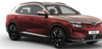
Crimson Velvet - Mystery Bronze