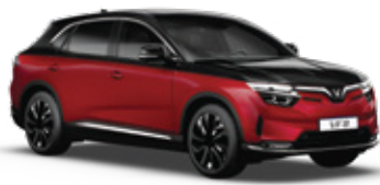
Crimson Red - Jet Black