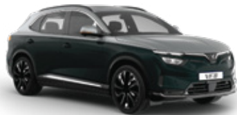
Ivy Green - Desat Silver