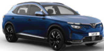
Atlantic Blue - Aquatic Azure