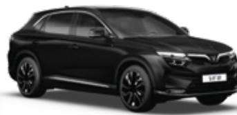
Jet Black - Graphite