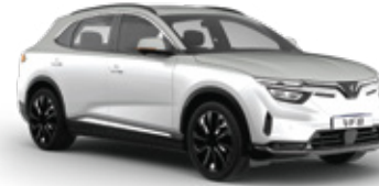
Infinity Blanc - Silky White