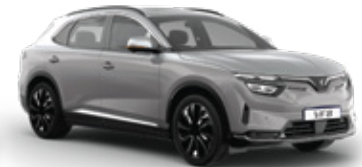
Zenith Grey - Desat Silver