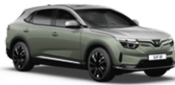
Urban Mint Green - Desat Silver