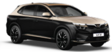
Jet Black - Champagne Creme