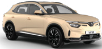
Champagne Creme - Matte Champagne Creme